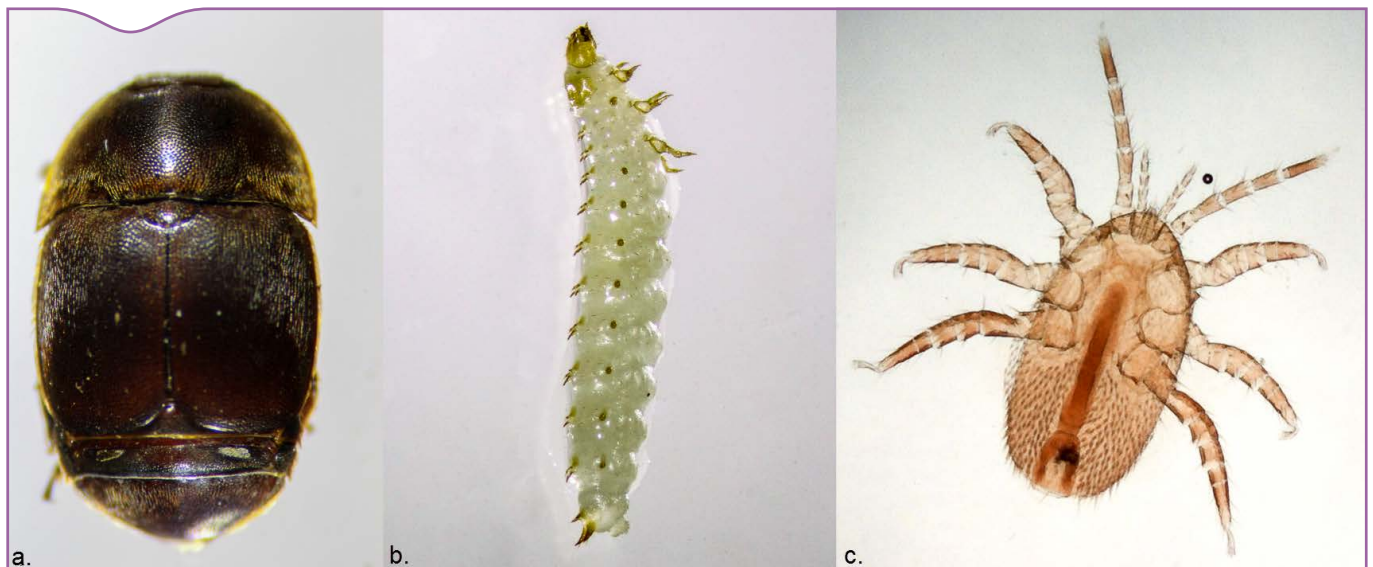
Figure 1. Les espèces invasives exotiques en Europe : petit coléoptère ( Aethina tumida ) (a/adulte et b/larve) et l'acarien Tropilaelaps spp. (c/adulte)

Dans le domaine de la santé de l'abeille, il existe peu de méthodes de référence à l'exception de celles publiées dans le Manuel des tests de diagnostic et des vaccins pour les animaux terrestres de l'OIE. De plus, peu de méthodes sont validées. Le laboratoire travaille sur l'élaboration de nouvelles méthodes et procède à leur validation selon les normes internationales de qualité. Il est accrédité par le Comité français d'accréditation (Cofrac) pour plusieurs lignes d'analyses.